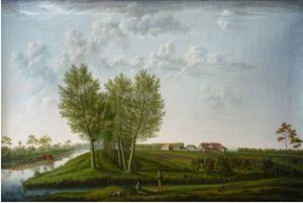
Un tableau montrant une vue d'un jardin anglais tombé dans le domaine public

En anglais il faut réaliser un exposé illustré : j'ai envie de prendre des photos sur internet.