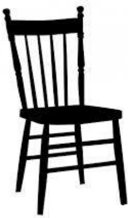
Figure 1 : Une chaise libre de droits

Un élève de ma classe est fan de ma dernière planche sur la chaise AST-Trévis, une planche d'arts appliqués tout en rouge et vert au crayon de couleur, très personnelle et pour laquelle j'ai fourni un gros effort intellectuel. Elle est tellement originale que je me demande si un expert du droit la considérerait vraiment comme une œuvre !